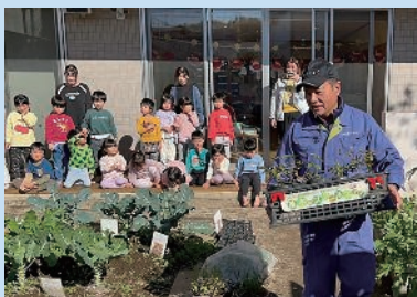
スクールステイ苗木の回収