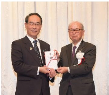
さいたま緑のトラスト基金への寄附