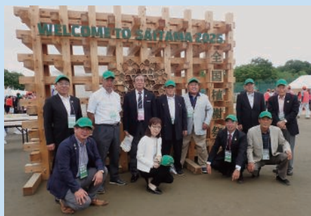
全国植樹祭式典参加者

埼玉県造園業協会では、全国植樹祭の開催に向けて、指定管理者である県営公園における植樹祭PR活動や記念植樹会場の植栽基盤診断調査業務に加え、幼稚園などで育成した苗木の回収・搬入業務、天皇陛下がお手植えされたスギ苗木の根巻き業務を受託し、会員各社のご協力のもと実施しました。