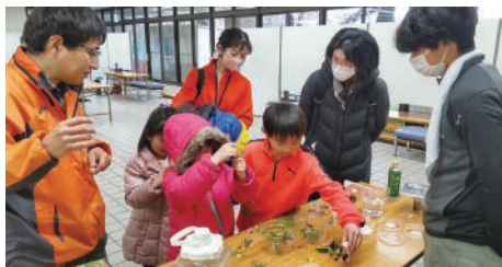
春の野草といきもの観察会