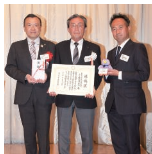
「彩の国みどりの基金」への寄附