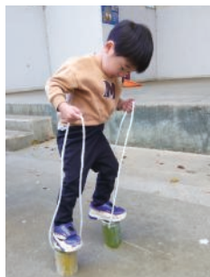
竹ぽっくりづくり

令和7年4月6日(日)、「空フェス」が開催され、春の心地よい陽気の中、多くの来園者で賑わいました。当協会は田中造園、榎本造園、土方造園が中心となって、園内の竹を活用した「竹ぽっくりづくり」を開催しました。軽快な音を響かせながら歩く子どもたちの楽しそうな姿が印象的でした。その他、「作って飛ばそう手作り竹とんぼ」、「花苗・雑貨・菓子販売」を実施しました。