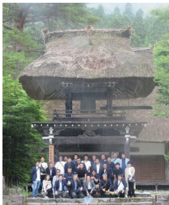
白川郷「明善寺 鐘楼門」にて