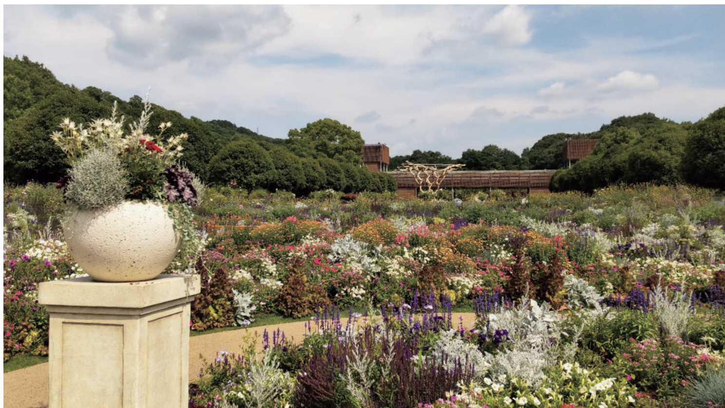
ぎふワールド・ローズガーデン