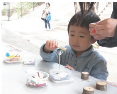
作って飛ばそう手作り竹とんぼ